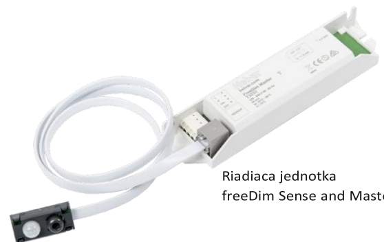
Riadiaca jednotka freeDim Sense and Master