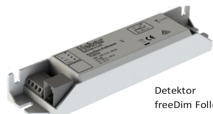
Detektor freeDim Follower